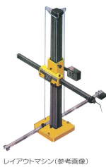
レイアウトマシン(参考画像)